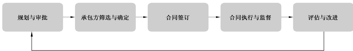
图2 发包工作过程示意图